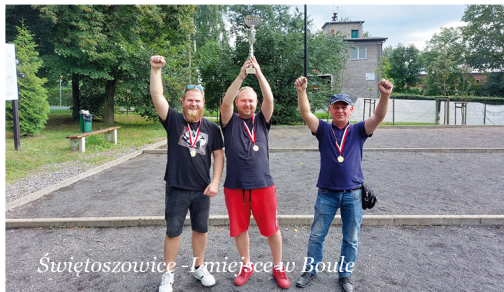
Świętoszowice - I miejsce w Boule

drużyn, które najpierw rozegrały fazę grupową, by następnie przejść do fazy pucharowej. Czarnym koniem zawodów okazało się sołectwo Jaśkowice, które najpierw w ćwierćfinale pokonały faworyzowane Przechlebie, a następnie w półfinale głównego pretendenta do zwycięstwa zespół z Ziemieć. Triumfotorem okazał się zespół ze Świętoszowic, który najpierw przełamał kłatwę Czekanowa, a następnie pewnie pokonał Księżę Las, i w finale zwyciężył z Jaśkowicami 10-3. Trzecie miejsce zajęli zawodnicy z Ziemieć, pokonując Księżę Las 13-4. Kolejne zawody (w kręgle) zaplanowano na 12 października. red.