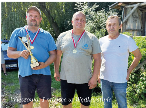
Wieszowa - I miejsce w Wędkarstwie

Zawody wędkarskie w ramach Wieloboju Sołectw złowili reprezentanci Wieszowy. Duet z tego sołectwa mógł się pochwalić wynikiem 10,94 kg, czyli ponad 3 kg lepszym od drugiego Kamieńca (7,59 kg) oraz trzeciego Czekanowa (7,06 kg). Łącznie w zawodach nad stawem w Kamieńcu wzięło udział 15 sołectw.