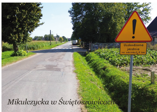
Mikulczycka w Świętoszowicach

Całość zadania to koszt ponad 16 mln zł. 50% kosztów zadania pokryją środki z Rządowego Funduszu Rozwoju Dróg. Gmina Zbroślawice oraz Powiat Tarnogórski pokryją po 25% kosztów (po ponad 4 mln zł). Firma ma teraz 24 miesiące na realizację przedsięwzięcia.