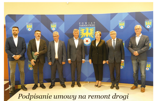
Podpisanie umowy na remont drogi