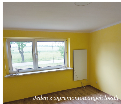
Jeden z wyremontowanych lokali