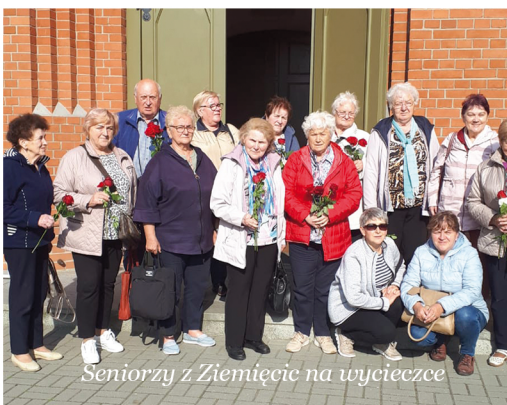
Seniorzy z Ziemięcic na wycieczce

Od wiosny, we współpracy z Klubem Seniora ze Zbrosławic, zdażyliśmy już zwiedzić Nysę i Sanktuarium św. Rity w Głębinowie, Pustelnię Złotego Lasu w Rytwianach i stolicę polskiej śliwki – Szydłów.