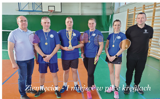
Ziemięcice - 1 miejsce w piłce kręglach