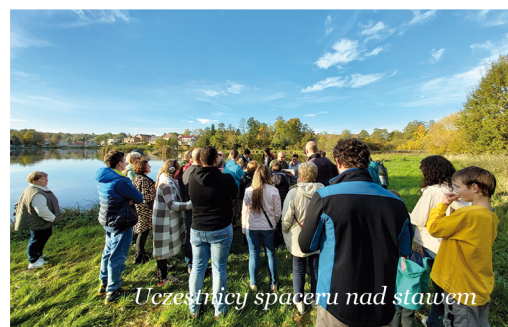
Uczestnicy spaceru nad stawem