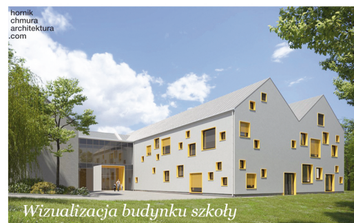
Wizualizacja budynku szkoły

Dzięki rozbudowie budynek zostanie dostosowany do wymogów oraz potrzeb lokalnej społeczności. Uczniowie otrzymają do swojej dyspozycji salę gimnastyczną oraz nowoczesny, przestronny segment, dostosowany również do wymogów związanych z funkcjonowaniem osób niepełnosprawnych.