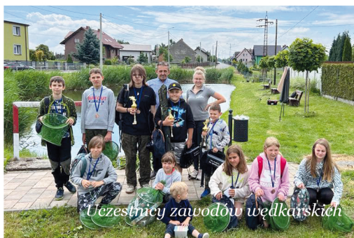
Uczestnicy zawodów wędkarskich

Organizatorzy dziękują wszystkim osobom, które przyczyniły się do organizacji zawodów na czele z Gminnym Zakładem Komunalnym - fundatorem atrakcyjnych nagród dla młodych adeptów wędkarstwa. Klaudiusz Aplik