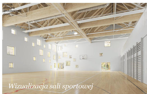
Wizualizacja sali sportowej

Zakresem inwestycja obejmuje m.in.: rozbiórkę części budynku istniejącego, budowę nowego segmentu szkoły wraz z instalacjami wewnętrznymi, przebudowę sieci kanalizacji sanitarnej i budowę instalacji zewnętrznych. W efekcie powstanie obiekt, z którego korzystać będzie mogło 200 uczniów i nauczycieli. W nowym segmencie będzie miejsce na 5 klas lekcyjnych, pokój nauczycielski, szatnia, dyżurka, jadalnia/świetlica, węzły sanitarne, sala gimnastyczna z boiskiem o wymiarach 15,5 x 25,5 m, pomieszczenia gospodarcze i techniczne. Termin zakończenia ustalony został na marzec 2025 r. GK