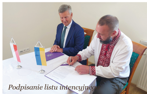
Podpisanie listu intencyjnego

Hrebinky - gmina leżąca w samym sercu obwodu kijowskiego mieści się 60 kilometrów od stolicy Ukrainy. Tworzą ją 2 osady miejskie oraz 10 wsi, a ogólna populacja wynosi 13 644 osoby. W gminie nie prowadzono aktywnej operacji wojskowej, ale do marca 2022 r. linia frontu była na tyle blisko, że, zdarzały się ataki powietrzne. Od pierwszych dni wojny z terenu gminy do sił ochotniczych zgłosiło się ponad 1000 osób.