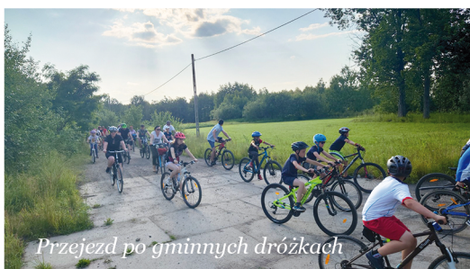
Przejazd po gminnych drózkach

LGD "Leśna Kraina Górnego Śląska" we współpracy ze zrzeszonymi gminami, w tym z Gminą Zbrosławice, rozpoczęło intensywne prace nad przygotowaniem szlaków rowerowych, których łączna długość wyniesie ponad 400 kilometrów. Znakowane trasy, wśród których pojawi się również "Pętla Zbrosławicka" powinny być gotowe jesienią tego roku. W planach jest także przygotowanie wiaty, która będzie miejscem odpoczynku dla rowerzystów.