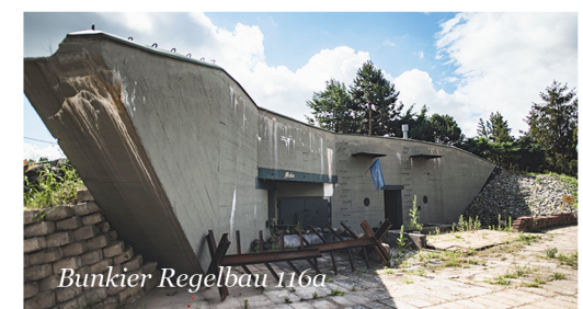
Bunkier Regelbau 116a

Okazując bilet do kopalni lub z podróży wąskotorówką będzie można bezpłatnie zwiedzać Bunkier Regelbau 116a w Zbrosławicach w terminach: czerwiec - 03.06 (sobota – 10:00 – 12:00), 24.06 (sobota – 10:00 – 12:00); lipiec: 02.07. (niedziela – 10:00 – 16:30), 29.07 (sobota – 10:00 – 12:00). Do zwiedzania zapraszają: Lokalna Organizacja Turystyczna Miasta Gwarków oraz Gmina Zbrosławice. red.