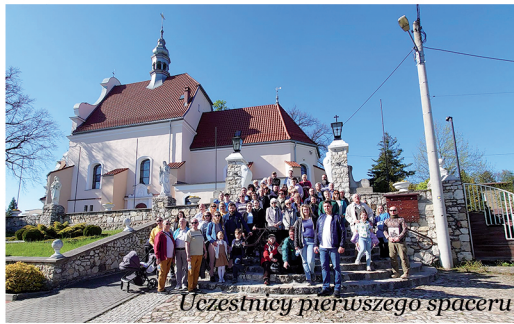
Uczestnicy pierwszego spaceru