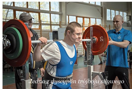
Jedną z dyscyplin trójboju siłowego

W zawodach rywalizowali przedstawiciele klubów m.in. z Raciborza, Wyr czy Zabrze, a także gospodarze z Miedar. Organizatorem zawodów był Oddział Regionalny OSS wraz z KOS "Sokoły" Miedary. Wsparcie finansowe zapewniła z kolei Gmina Zbrosławice, a także Samorząd Województwa Śląskiego.