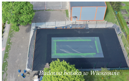
Budowa boiska w Wieszowie

Boisko o nawierzchni poliuretanowej otoczone będzie piłkochwytem o wysokości 4 metrów. Zadanie dofinansowane jest ze środków Programu Rozwoju Obszarów Wiejskich na lata 2014-2020 w kwocie 185 882,00 zł. Łączna wartość inwestycji to 364 080,00 zł. Planowany termin zakończenia realizacji to czerwiec bieżącego roku. ZS