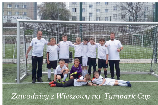
Zawodnicy z Wieszowy na Tymbark Cup