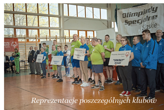
Reprezentacje poszczególnych klubów