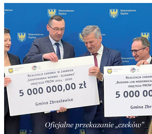
Oficjalne przekazanie „czeków”

Na realizację przedmiotowych zadań, Gmina