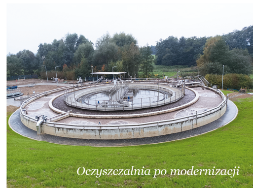
Oczyszczalnia po modernizacji

Wykonawcą robót jest Przedsiębiorstwo Budowlane „MODUŁ” Sp. z o.o. z Gorlic, a nadzór inwestorski pełnił w ramach funkcji inżyniera kontraktu Gminny Zakład Komunalny Sp. z o.o. w Zbrostawicach.