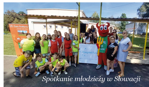
Spotkanie młodzieży w Słowacji

Polscy uczniowie w dniach 11-15 września odwiedzili swoich przyjaciół ze Słowacji. Uczestniczyli w Dniu Sportu, wzięli udział w grze miejskiej w Koszycach, skakali na trampolinach oraz uczestniczyli w lekcji judo. Spotkanie projektowe nosiło tytuł: „jesteś tym, co jesz i co robisz!”