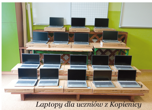
Laptopy dla uczniów z Kopienicy

Na podstawie umowy ze Skarbem Państwa - Ministrem Cyfryzacji, a Wójtem Gminy Zbrostawice, 148 uczniów klas 4 szkół podstawowych naszej gminy otrzymało laptopy. Wartość umowy opiewa na 431 070,72 zł.