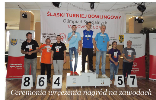
Ceremonia wręczenia nagród na zawodach