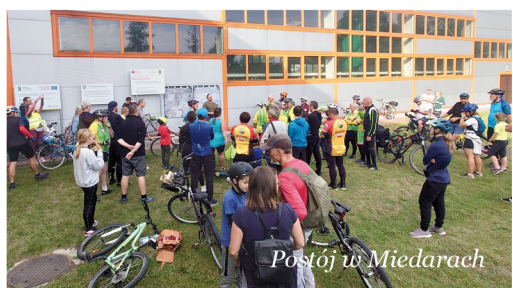
Północ w Miedarach

Wydarzenie odbyło się w ramach projektu TRASA, który obejmuje również stworzenie i oznakowanie szlaków rowerowych wiodących przez gminy zrzeszone w LGD. red.