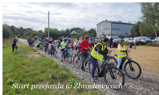
Start przejazdu w Zbrosławicach

Prawie 130 sympatyków jazdy na rowerze wyruszyło w październiku na trasę „Rajdu Rodzinnego z historią w tle”.