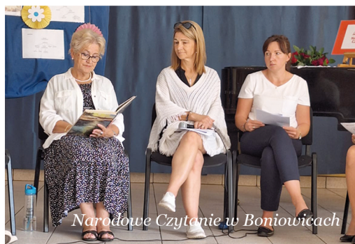
Narodowe Czytanie w Boniowicach

Akcja „Narodowe Czytanie” została zainicjowana w 2012 roku wspólną lekturą „Pana Tadeusza” Adama Mickiewicza. Spotkała się z życzliwym odzewem, więc co roku odbywa się kolejna edycja tego wydarzenia. W ten sposób „odświeżyliśmy” dzieła Aleksandra Fredry, Henryka Sienkiewicza, Bolesława Prusa i wielu innych.