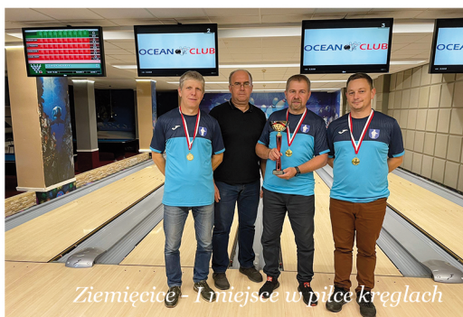
Ziemięcice - 1 miejsce w piłce kręglach

W rundzie finałowej na prowadzenie wyszło Ziemięcice z największą sumą punktów - 699. Kopienica po ciężkiej walce znalazła się na drugim miejscu (666 punktów), a 3 miejsce należało do Czekanowa (595 punktów). Kolejne zawody (badminton) 4 listopada w Miedarach.