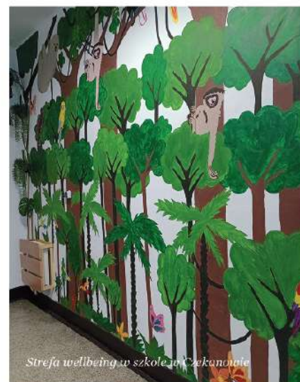
Strefa wellbeing w szkole w Czekanowie