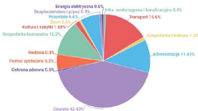
Podział wydatków budżetu na 2024 rok