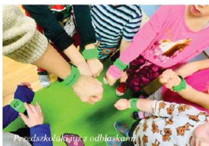
Przedszkolaki już z odblaskami

W okresie jesienno-zimowym, gdy szybko zapada zmierzch, należy szczególnie zadbać o widoczność pieszych i rowerzystów. Odblaski pozwalają nawet kilkakrotnie zwiększyć widoczność osób poruszających się po drogach i poboczach.