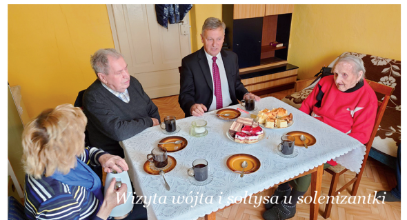
Wizyta wójta i sołtysa u solenizantki