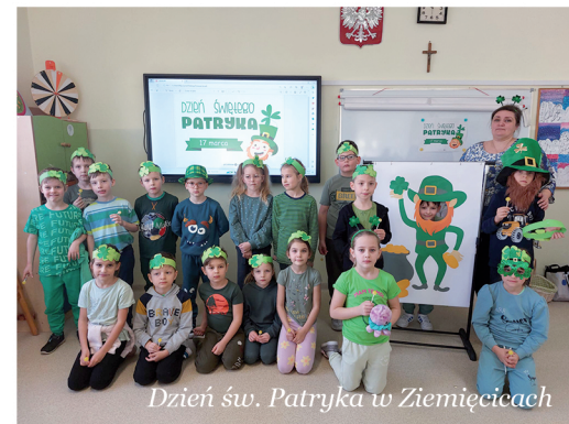
Dzień św. Patryka w Ziemięcicach

Mamy zatem nadzieję, że dzień 17 marca na stałe wpisze się w kalendarz wydarzeń Szkoły Podstawowej w Ziemięcicach. A.Smoleń-Bieniasz