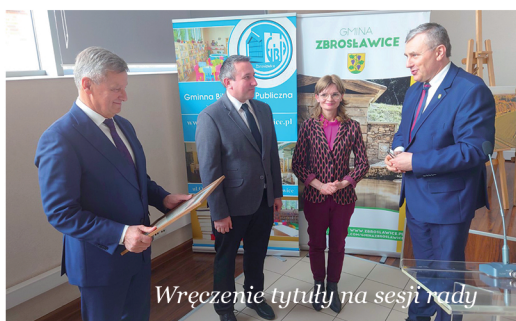
Wręczenie tytułu na sesji rady

Informujemy iż zmianie uległa cena węgla sprzedawanego za pośrednictwem UG Zbrosławice. Obecnie można zakupić węgiel w cenie 1 650,00 zł za tonę. Wszystkich zainteresowanych, którzy jeszcze nie skorzystali z zakupu po preferencyjnych cenach prosimy o kontakt z Wydziałem Ochrony Środowiska i Rolnictwa - tel. 32 233 77 20 i 32 666 44 08. OS