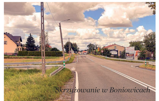
Skrzyżowanie w Boniowicach

16 miesięcy od daty podpisania umowy. Do czasu realizacji nie będzie się wliczał okres zimowy (tj. od 16 grudnia do 15 marca).