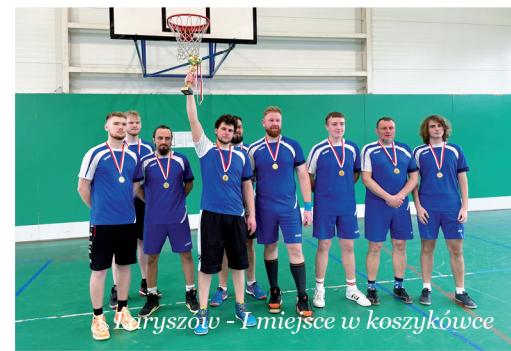
Laryszów - 1 miejsce w koszykówce

rzut osobisty na 4 sekundy przed końcem czasu gry (16:15). W finale Laryszów pokonał Łubie (16:8), natomiast Przechlebie nie dało szans Miedarom w meczu o miejsce trzecie (19:9). Łącznie w zawodach wzięło udział 11 reprezentacji sołectw. Na szczycie klasyfikacji generalnej po 3 dyscyplinach ze sporą przewagą znajdują się Miedary. Kolejna okazja do powiększenia swojego dorobku punktowego już 22 kwietnia, w trakcie zawodów trójboju lekkoatletycznego. red.