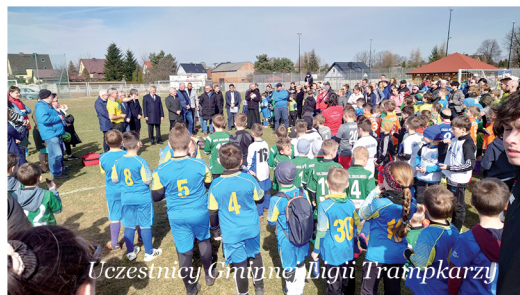
Uczestnicy Gminnej Ligi Trampkarzy