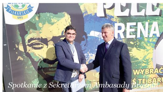
Spotkanie z Sekretarzem Ambasady Brazylii